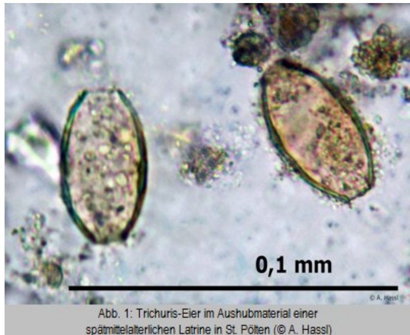
Abb. 1: Trichuris-Eier im Aushubmaterial einer spätmittelalterlichen Latrine in St. Pöten

Die Kenntnis der Art des Parasiten ist also eine Vorbedingung für das Ableiten von Schlussfolgerungen über die äußeren Umstände, die zum Befall geführt haben. Während sich der diagnostische Sachverhalt im Falle von Fäkalien aus Mumien meist recht einfach darstellt, kann es bei Koprolithen bereits zu ernstlichen Zweifeln an der Richtigkeit der Interpretation eines Ergebnisses